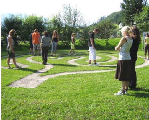
Jugendliche bei einer meditativen Übung im Rasenlabyrinth