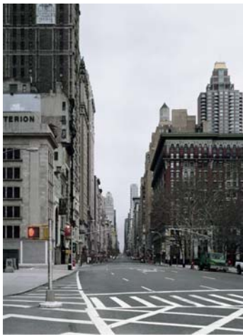
Fotografie von Ralf Kaspers: Du sollst den Sabbat heilig halten

Ich bin JHWH, dein Gott, der dich aus Ägypten geführt hat, aus dem Sklavenhaus. (Ex 20,2)